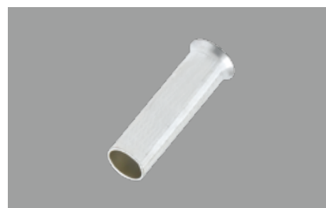
1506 歐式裸端子 NON-INSULATED CORD END TERMINAL